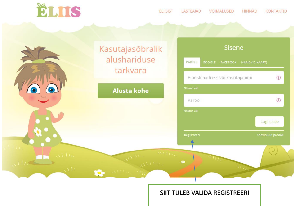
PILT 1. Sisenemine infosüsteemi: Registreeri

Ava veebileht www.eliis.ee . Rohelisest kastikesest (sisenemine infosüsteemi) tuleb alt valges kirjas valida „Registreeri“.