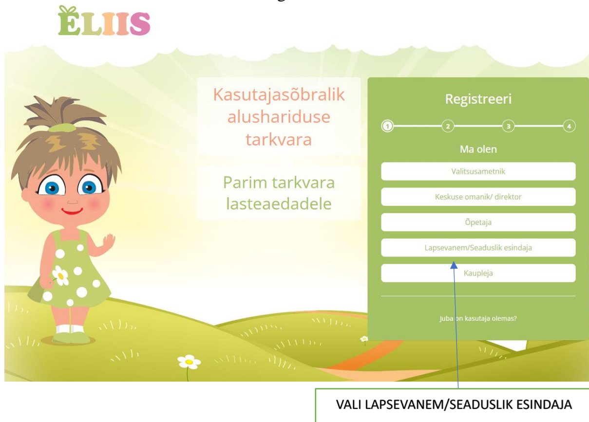
PILT 2. Sisenemine infosüsteemi: Lapsevanem/Seaduslik esindaja