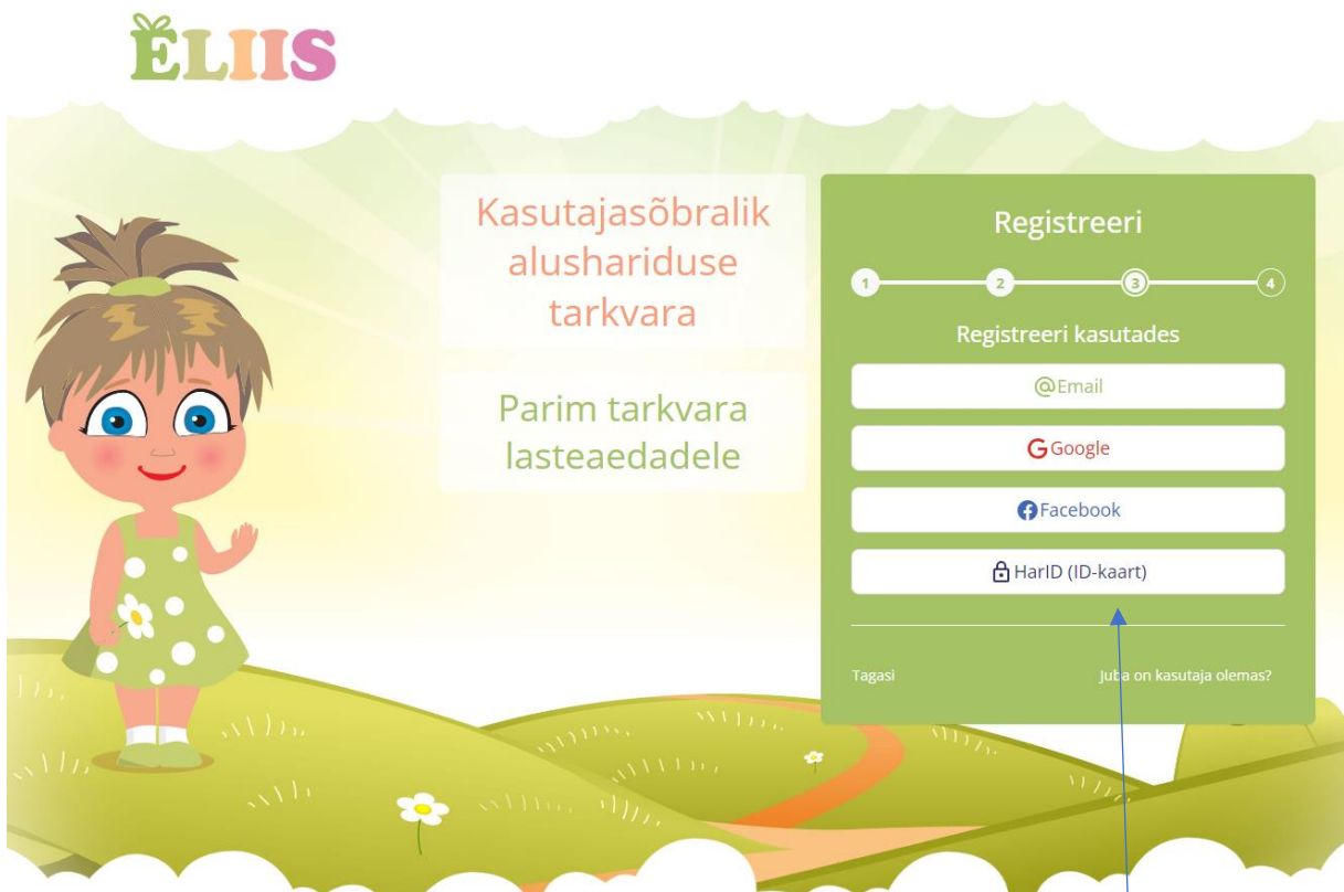
PILT 3. Sisenemine infosüsteemi: Vali riik

VALI RIIK, MIS KEELES ELIISI INFO SULLE KUVATAKSE